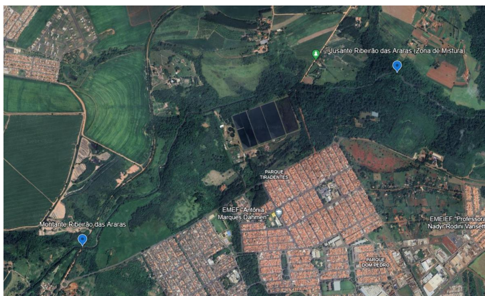
Localização dos pontos 01 e 05 do Lote 02 – Fonte: Imagem Google Earth