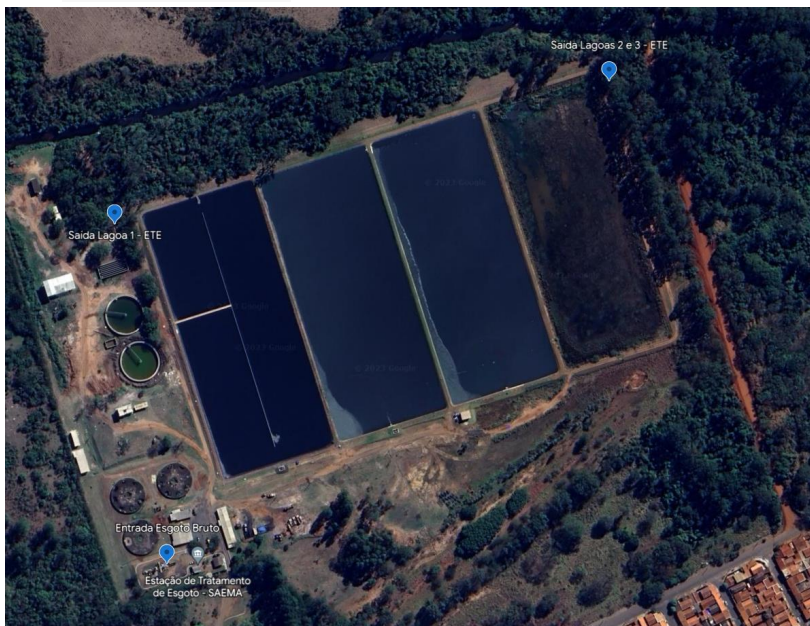
Localização dos pontos 02, 03 e 04 do Lote 02